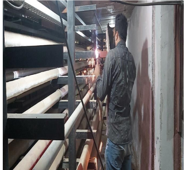
۱۰- اجرای کابلها و اتصال برق ساختمان آزمایشگاه مرکزی به موتورخانه