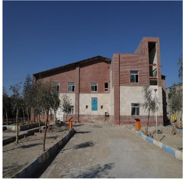
۸- اجرای سرپرستی، نگهداری و سرویس های بهداشتی سالن تهmine